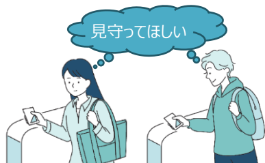
【契約者（サービス対象者）】

※高校生（満18歳の3月31日まで）で契約中の場合、自動更新はされません。契約終了後に、サービス対象者ご本人による新規入会が必要となります。