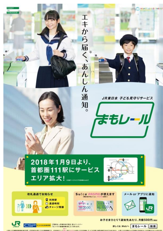
「まもレール」イメージポスター

本件プレスリリースは、ときわクラブ、丸の内記者クラブ、JR記者クラブ、国土交通記者会、レジャー記者クラブへお届けしています。