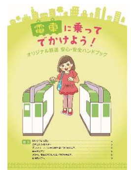
ハンドブックイメージ